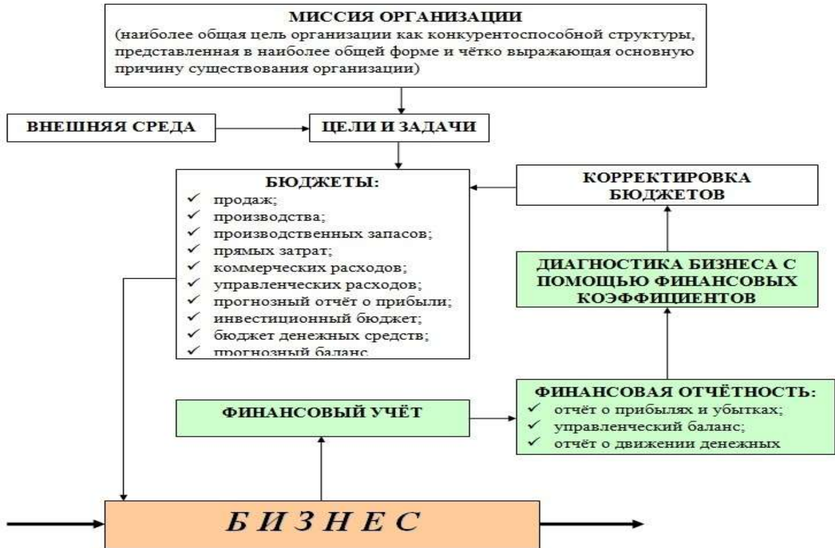
СХЕМА ФИНАНСОВОГО УПРАВЛЕНИЯ БИЗНЕСОМ